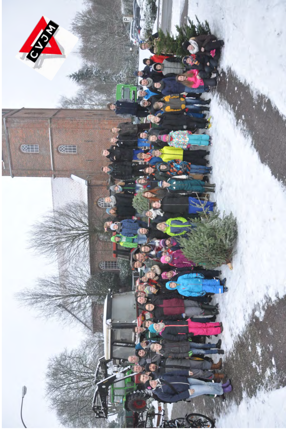
„Das WBAA - Helferteam 2017“